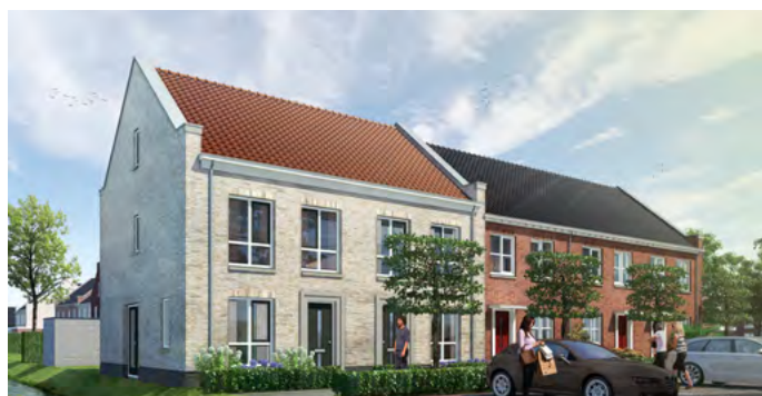
Artist Impression: Bunschoten - Rengerswetering

Onlangs is de 1.000 ste woning opgeleverd. Dit betrof een woning in het project Bunschoten Rengerswetering, aangekocht door het Ecowoningen Fonds. De 1.000 ste huurder zal binnenkort, Corona-proof, in het zonnetje worden gezet. Daarnaast is ook de 2.000 ste woning aangekocht. Dit betrof een appartement in het voor Huurwoningen Nederland Fonds II aangekochte appartementencomplex (61 appartementen) aan de Frankrijkstraat te Eindhoven.