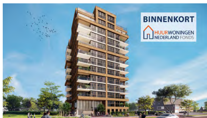
Artist Impression: Almere - Homerustoren

Verdere details vindt u in het prospectus en de brochure die vermoedelijk medio februari (na goedkeuring door de AFM) beschikbaar zullen komen. U kunt geen participaties reserveren (dat is immers wettelijk niet toegestaan), maar wij kunnen u bij de start van de emissie een informatiepakket doen toekomen. U kunt de informatie dan ook op onze website downloaden .