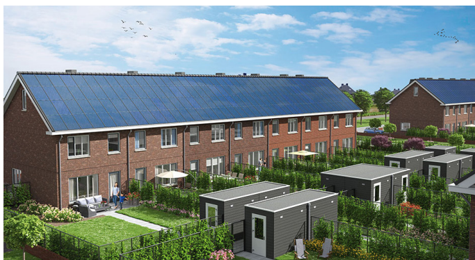
Artist Impression: Emmen - Delftlanden